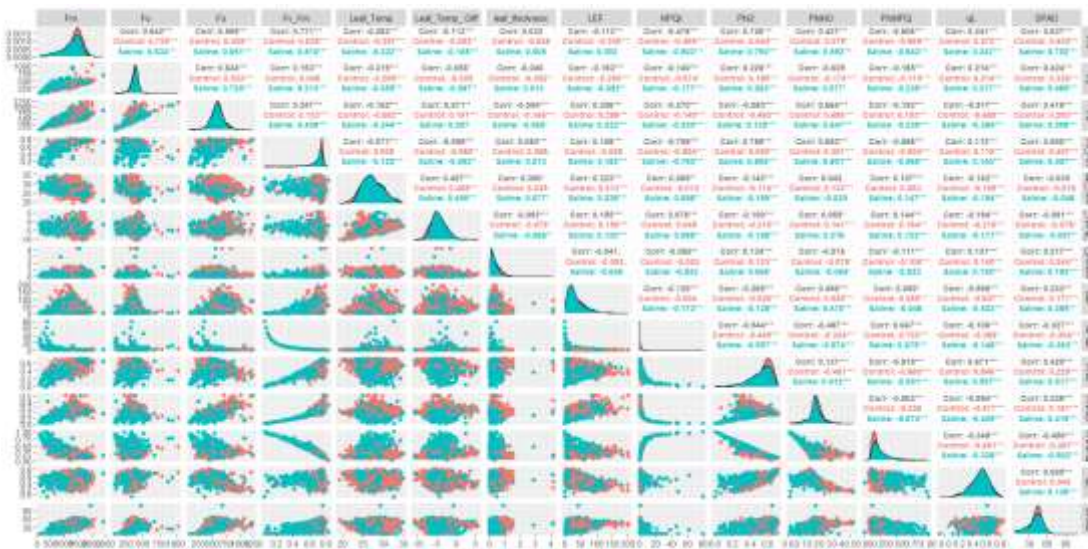
Figura 2. Matriz de correlación y distribución los parámetros de fluorescencia de la clorofila utilizados en este estudio. Para más detalles de estos parámetros ver https://help.photosynq.com/view-and-analyze-data/references-and-parameters.html#chlorophyll-fluorescence-pam .

Por último, el análisis de mapeo por asociación un total de 5, 8 y 6 SNP se asociaron significativamente con el peso seco, la altura y el SPAD de la planta, respectivamente (Figura 2).